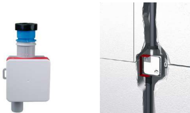
Рис. 3. Установка сифона HL138H в штробе.